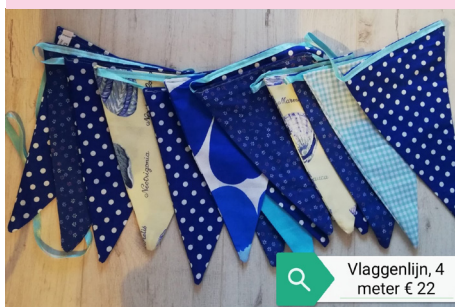
Vlaggenlijn, 4 meter € 22

Bestellen via Lilian, 06-24 165 309 of Karina 06-19 925 157