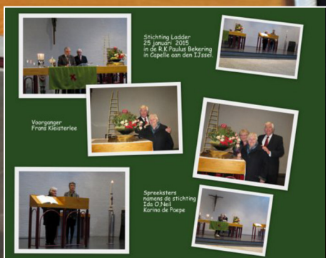
Stichting Ladder 25 januari 2015 in de R.K. Paulus Bekeking in Capelle aan den IJssel.